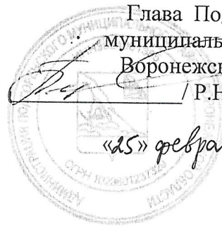
СХЕМА РАЗМЕЩЕНИЯ РЕКЛАМНЫХ КОНСТРУКЦИЙ НА ТЕРРИТОРИИ ПОДГОРЕНСКОГО МУНИЦИПАЛЬНОГО РАЙОНА ВОРОНЕЖСКОЙ ОБЛАСТИ